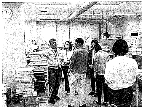
印刷・製本工程の見学の様子

重要な取り組みです。障害者優先調達推進法は、その一つの手段として、就労機会の拡大や収入の向上に貢献しています。しかし、まだまだ認知度や利用率の向上が課題となっています。就労支援施設が提供する物品やサービスは、高品質で多様なものがあります。日韓両国のこうした交流を通じて、情報や経験を共有しお互いが発展することで、より良い福祉サービスの提供に繋がるよう取り組んでいきたいと思えます。韓国障害者開発院の皆さまの研究の一助になれば幸いです。